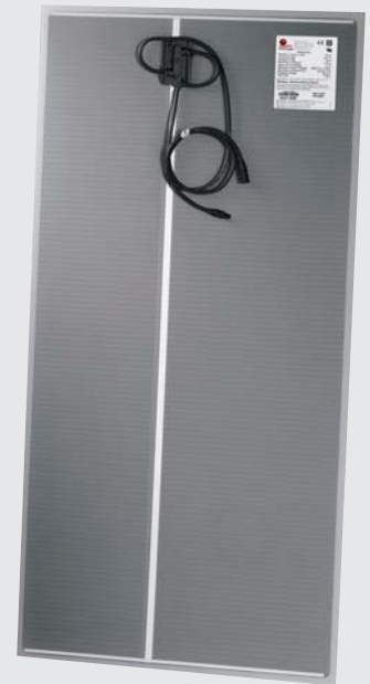
Solarmodul der Serie FS 2