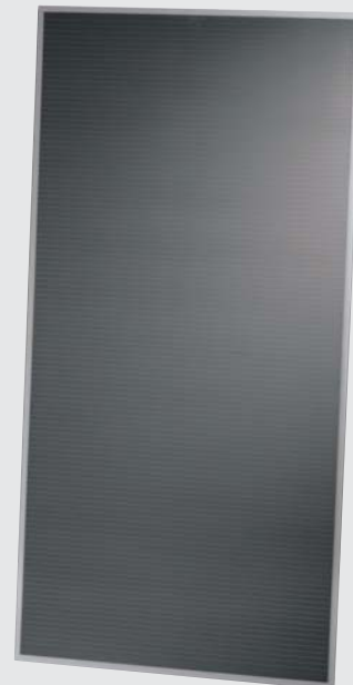
Solarmodul der Serie FS 2